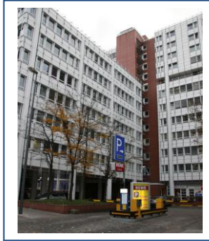
Einfahrt Bavaria-Tiefgarage (REWE) Gebäude