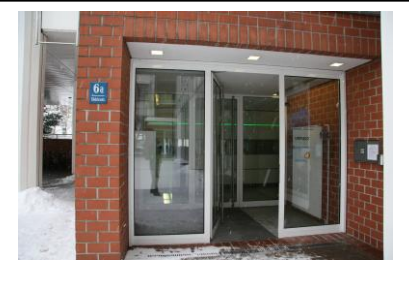
Eingang vom Parkplatz, Elektrastr. 6a oder durch die Tiefgarage 1. UG mit dem Lift in den 4.Stock zu CBT Training & Consulting