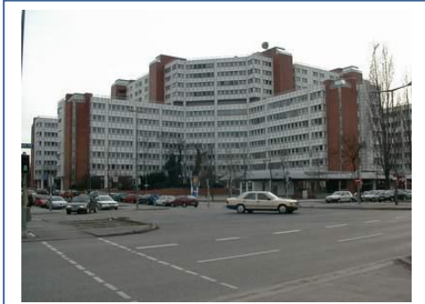
Gebäude, Straßenkreuzung: Engelschalkinger Straße, Elektrastraße, Arabellapark

Parkplätze Elektrastraße oder Engelschalkinger Straße (Seitenstreifen kostenfrei) Park/Tiefgarage Elektrastraße 6a (REWE) Kostenpflichtig pro Tag € 20,00, für Kunden € 10,00 – bitte holen Sie sich am Empfang ein Ausfahrticket ab!