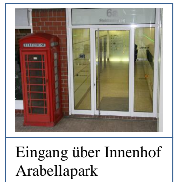
Eingang über Innenhof Arbellapark